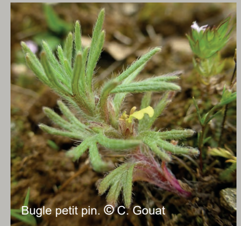
Bugle petit pin.