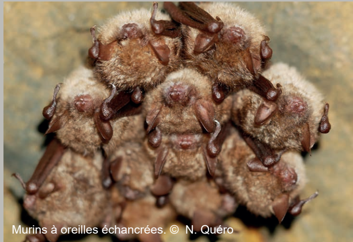
Murins à oreilles échancrées. © N. Quéro

Le réseau Natura 2000 est un ensemble de sites européens, désignés pour la rareté ou la fragilité des habitats naturels et des espèces animales et végétales qui s'y trouvent. Natura 2000 a pour vocation la conservation de ce patrimoine naturel en valorisant les usages locaux qui ont contribué au maintien de cette biodiversité.